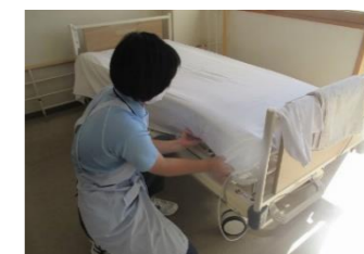
ベッドメイキング